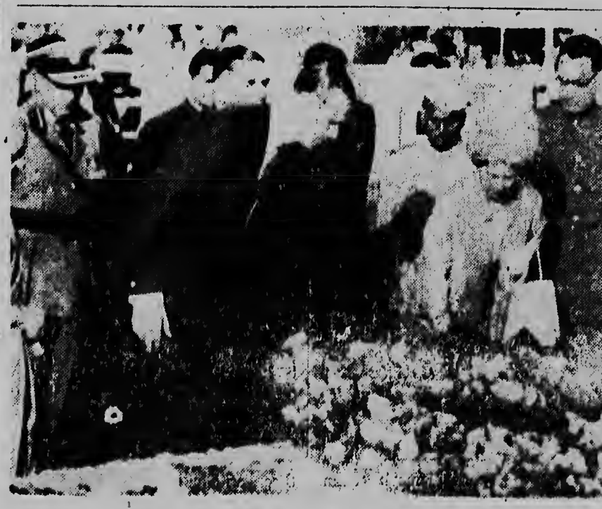
NA INDIA. — E viaje dje paraja britanica na India: Den tur e frialdad e paraja tabata pone un krans grandi riba graf di Mahatma Ghandi.